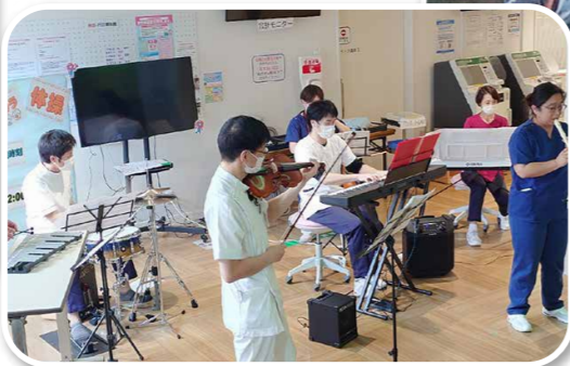
病院スタッフによるオープニング演奏