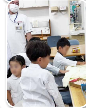
白衣体験・病院探検