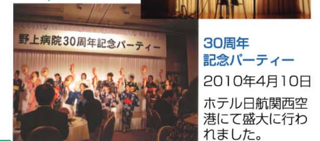
30周年 記念パーティー 2010年4月10日 ホテル日航関西空 港にて盛大に行わ れました。